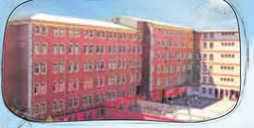
Okulumuzun Arka Cephesi