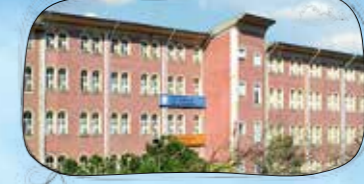
Okulumuzun Ön Cephesi

KAZIM KARABEKİR ANADOLU İMAM HATİP LİSESİ Nesilden Nesile Eğitimin Adresi FEN VE SOSYAL BİLİMLER PROJE OKULU